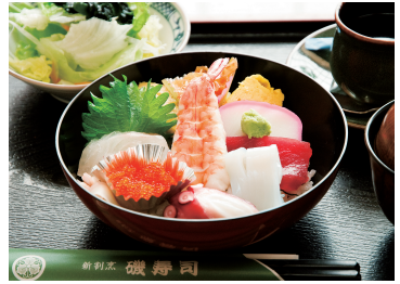
写真はイメージです。