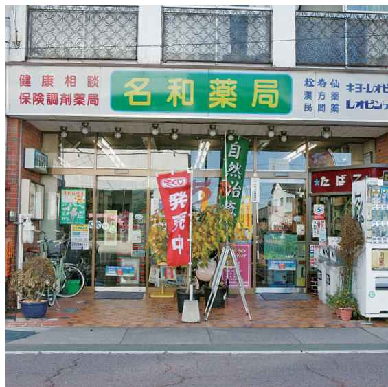
名和薬局店舗全景