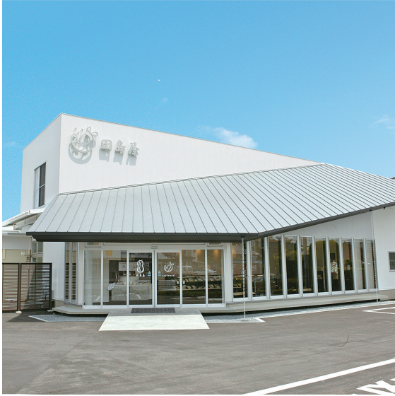
富岡ICより1分。駐車場もゆったり15台。