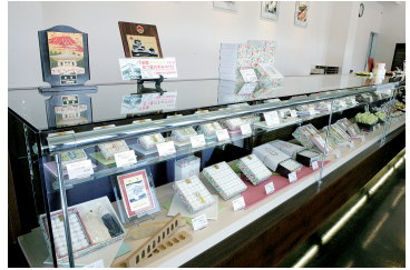
菓子詰め合わせも手土産に人気。

平成23年富岡ICすぐの場所に、新店舗「まゆ菓優 田島屋」をオープン致しました。富岡ICから富岡市内への玄関口ともなる立地。富岡からのお出かけの際、また富岡にお越しのお客様へ、富岡らしい商品をご提供いたします。